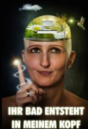
IHR BAD ENTSTEHT IN MEINEM KOPF